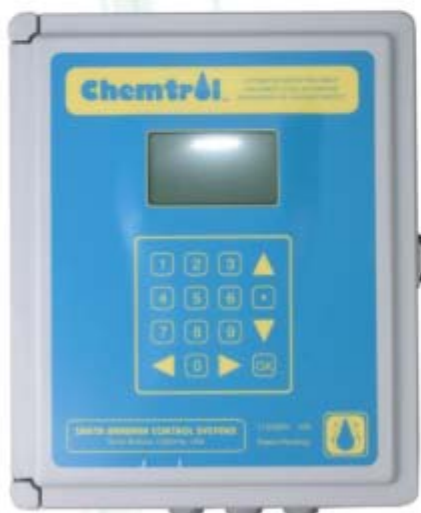
2000 # 水质监控仪监控 PH. ORP 可远程监控 Size: 240x300x15mm

人工投药药量不稳定，含氯/溴不足，细菌，藻类容易滋生。使用全自动监控仪，每天耗电不到1度，无须人工，自动控制水质，是商业家用泳池理想匹配产品。