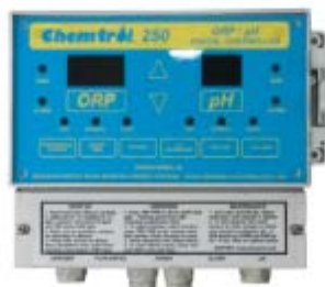
250 # 水质监控仪监控 PH. ORP Size: 240x200x120mm