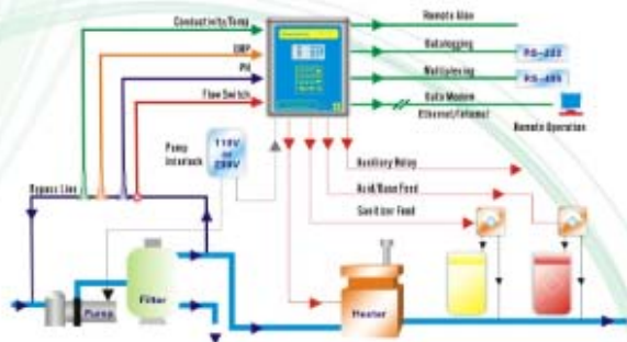
2000 # 安装示意图