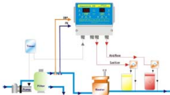
250 # 安装示意图